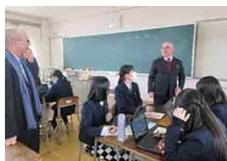
群馬県立女子大学