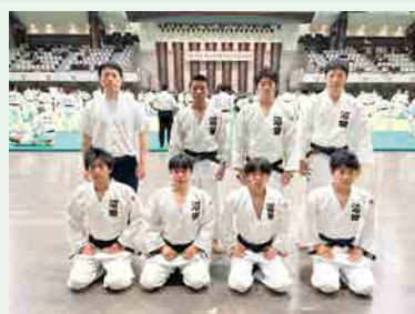
柔道部 高校総体 男子団体 第6位