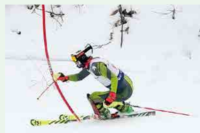
スキー部 IH予選 男子大回転 2位・4位 男子回転 2位・3位