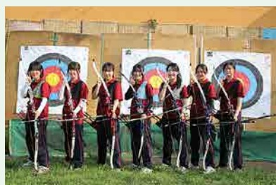
アーチェリー部 IH予選 女子団体 優勝