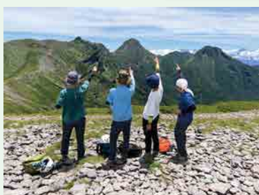
山岳部 高校総体 男子団体 準優勝