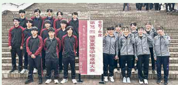
卓球部 IH予選 男子シングルス 準優勝 女子シングルス 準優勝