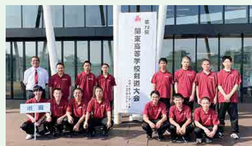
剣道部 IH予選 男子個人 準優勝