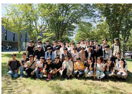
東北大学オープンキャンパスツアー