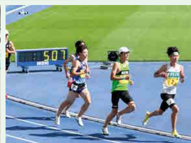
陸上競技部 高校総体 男子3000mSC 第5位