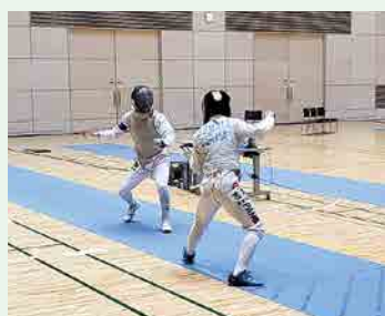
フェンシング部 IH予選 男子団体 優勝 男子フルーレ 優勝