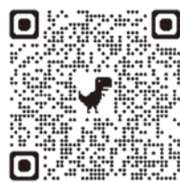
沼高 You Tube

9月以降の EVENT の様子は You Tube と Instagram に 随時アップロードします！ 下記の二次元コードから 是非様子を見てください！