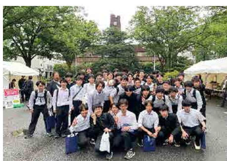
東大リサーチキャンパス

文系・理系の両方の進路に対応し、高度な学習内容に加え、高大連携や産学連携を推進しながら、様々な進路探究の機会を用意します。